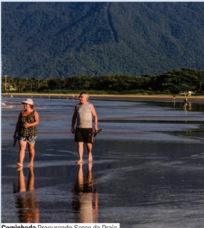
Caminhada Procurando Seres da Praia