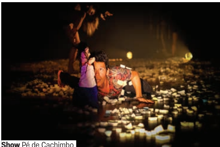
Show Pé de Cachimbo