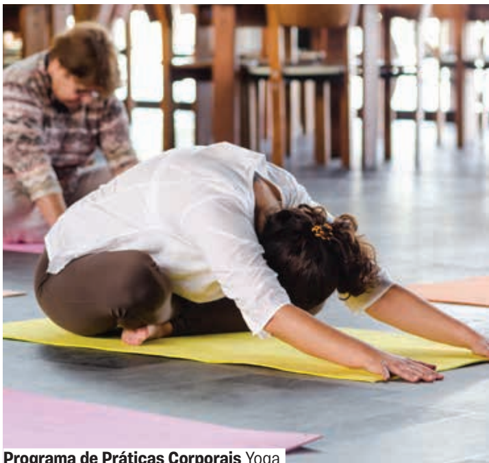
Programa de Práticas Corporais Yoga