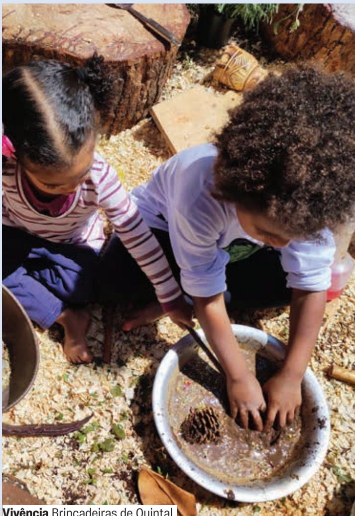
Vivência Brincadeiras de Quintal