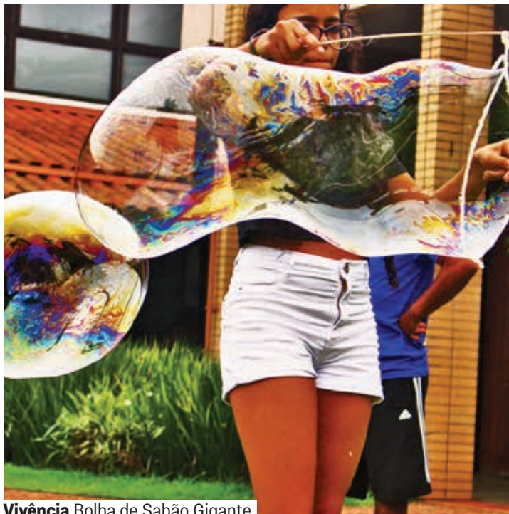
Vivência Bolha de Sabão Gigante