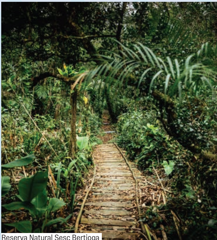
Reserva Natural Sesc Bertioga

Localizada a 700 metros da entrada do Centro de Férias, a Reserva é um espaço ao ar livre que protege uma área de mais de 600 mil metros quadrados de floresta de Mata Atlântica, dentro da cidade de Bertioga. Com recursos de acessibilidade, proporciona a todos e todas encontros com a natureza e suas relações. Você pode conhecer e aproveitar os espaços como o Jardim das Brincadeiras, a Trilha do Sentir e a Trilha do Tucum, ouvir o som dos pássaros e outros animais, sentir o vento ou simplesmente relaxar. É aconselhável vestir roupas leves, tênis e boné. Levar repelente, protetor solar e garrafinha de água. Menores de idade devem estar sempre acompanhados por um responsável.