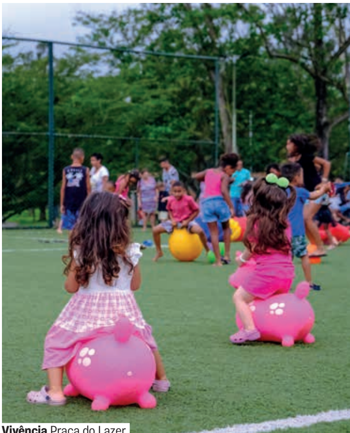
Vivência Praça do Lazer