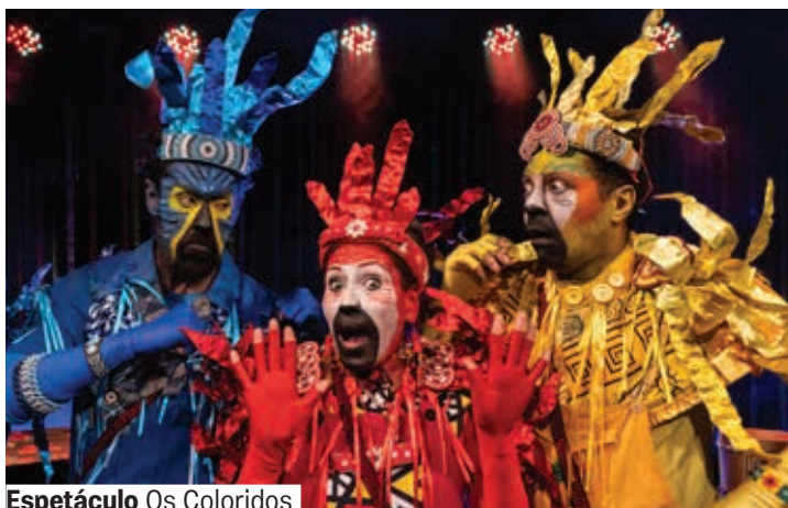
Espetáculo Os Coloridos