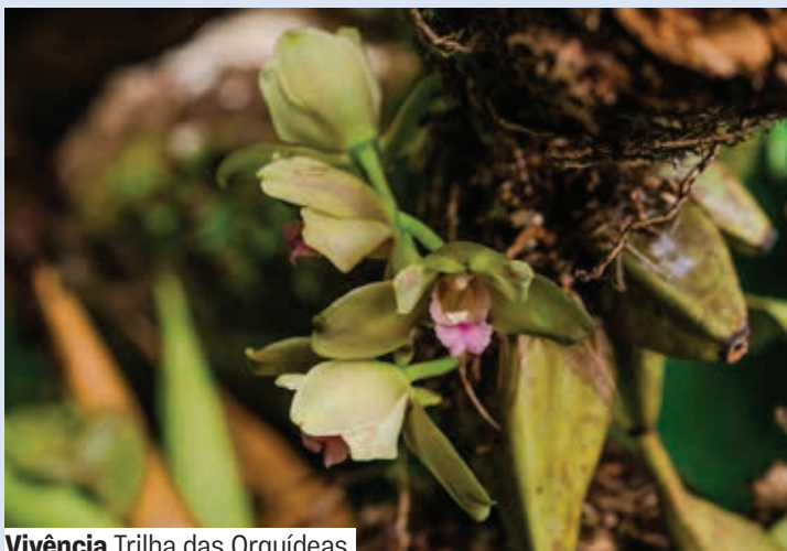
Vivência Trilha das Orquídeas