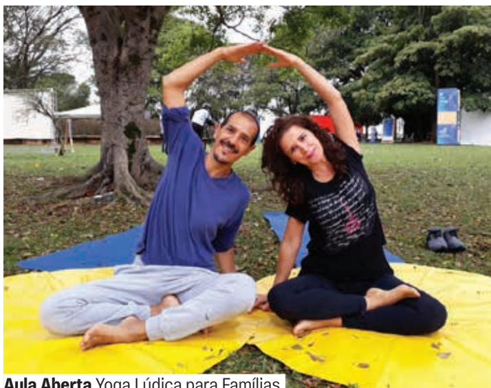
Aula Aberta Yoga Lúdica para Famílias