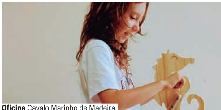
Oficina Cavalo Marinho de Madeira