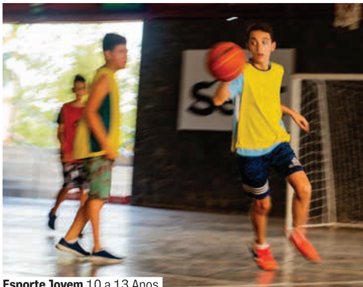
Esporte Jovem 10 a 13 Anos