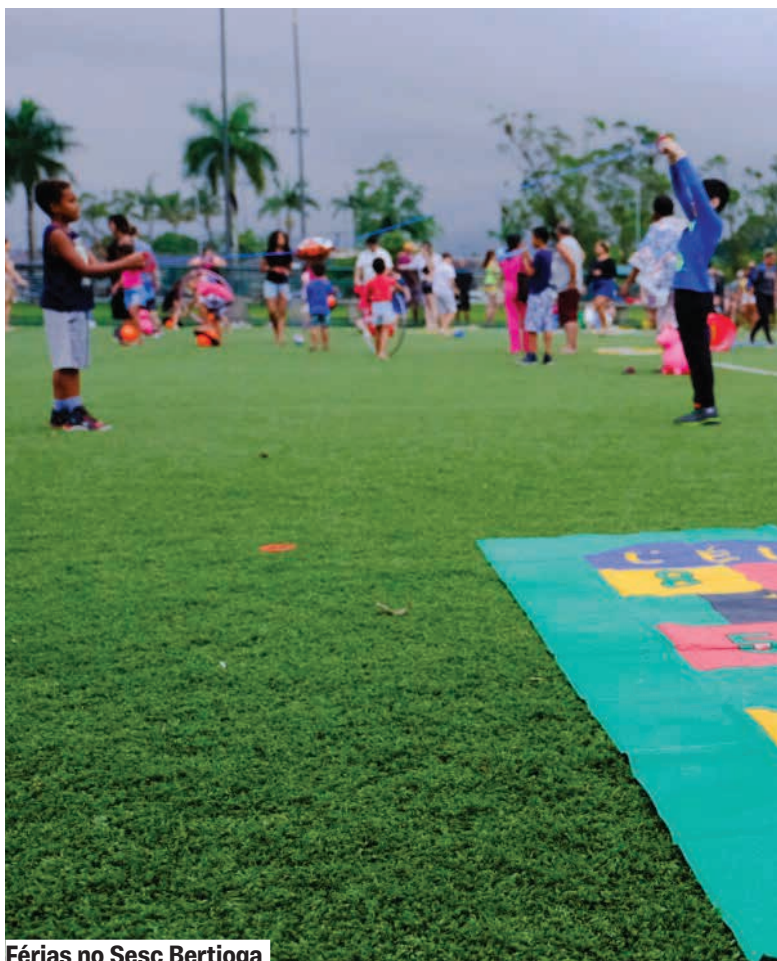
Férias no Sesc Bertogã

Para quem é da natureza, na Reserva Natural, além de poder desfrutar de toda a infraestrutura do local, passear nas trilhas e fazer piquenique no jardim das brincadeiras, as crianças ainda poderão participar de diversas vivências que estimulam o contato com elementos naturais. O destaque fica para a oficina “Construção de Objetos de Madeira”, com o grupo Marcenaria Infantil, onde as crianças aprenderão técnicas básicas de marcenaria para construir brinquedos.