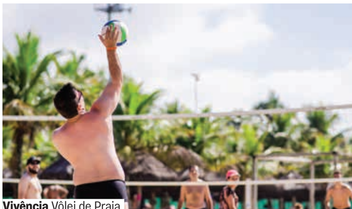
Vivência Vôlei de Praia