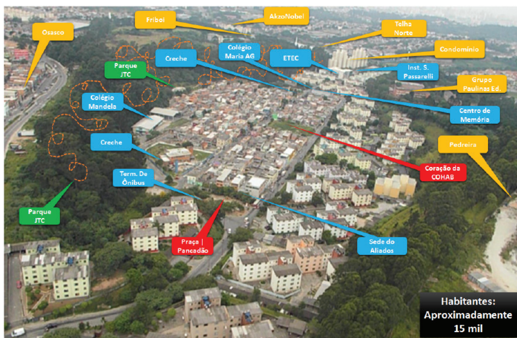
Figura 1: Território de atuação direta do grupo