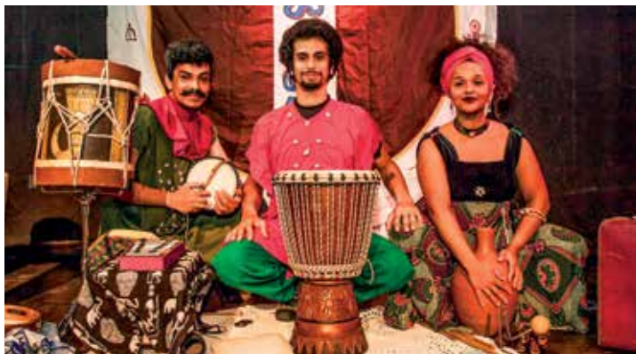
Espetáculo KARINGANA UA KARINGANA! Histórias de Áfricas

Dia 1/12. Domingo, 15h. Área de Convivência. Grátis. AL