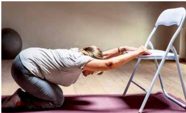
Aula Aberta Fortalecimento, Equilíbrio e Flexibilidade com Cadeira