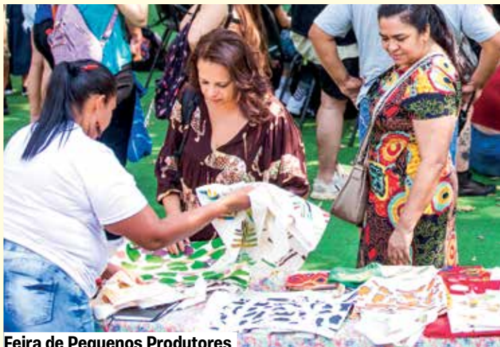
Feira de Pequenos Produtores