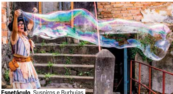
Espetáculo Suspiros e Burbujas