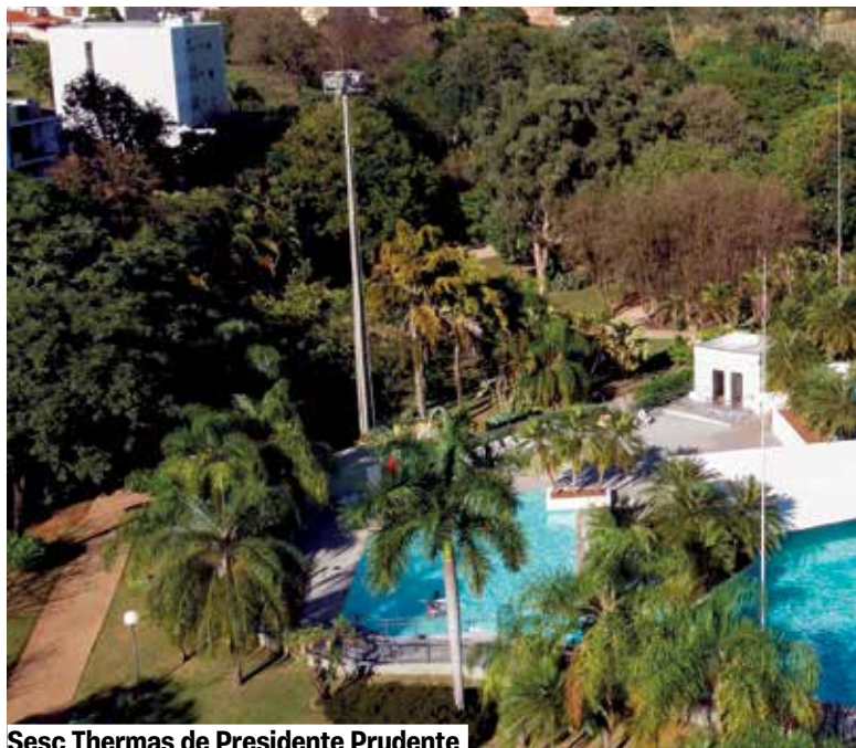
Sesc Thermas de Presidente Prudente

O Seminário de Esportes e Lazer para Pessoas com Deficiência traz minicursos - Parabadminton, Jiu-Jitsu para crianças com TEA, Jogos Digitais como Tecnologia Assistiva, Beach Tennis-;