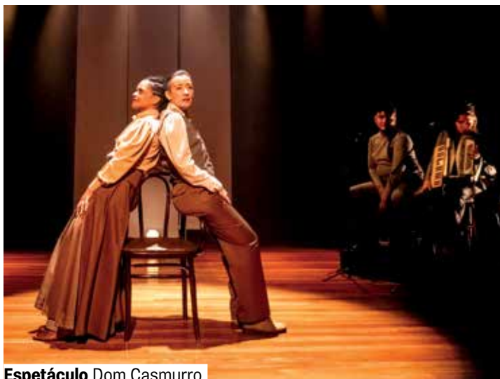
Espetáculo Dom Casmurro