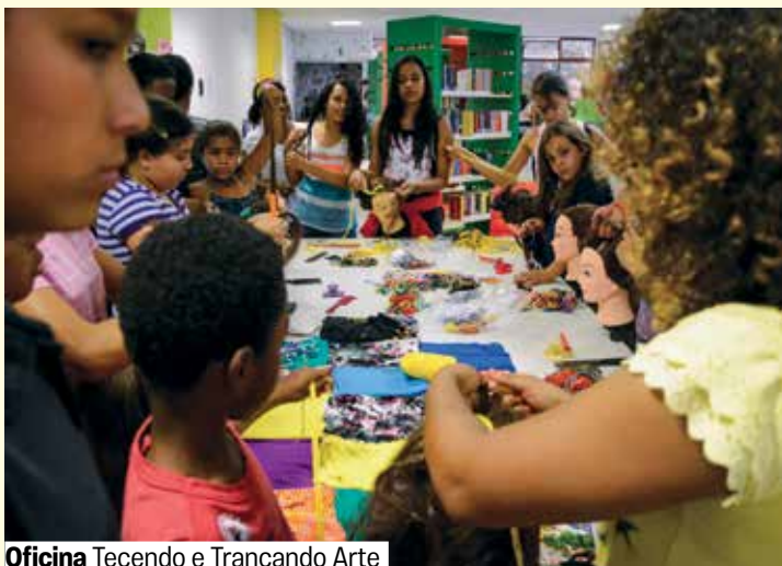
Oficina Tecendo e Trançando Arte

Inscrições a partir das 14h de 5/11, por meio do app Credencial Sesc SP, do site sescsp.org.br/prudente ou presencialmente na Central de Relacionamento (mediante agendamento).