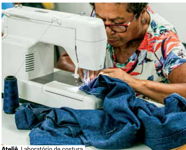
Ateliê Laboratório de costura

Vagas limitadas. Sujeito à capacidade do espaço.